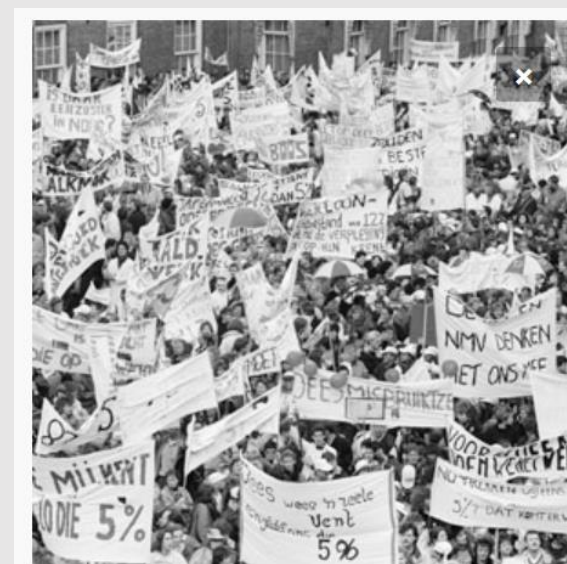
DEMONSTANTEN BINNENHOF, 15 MAART 1989